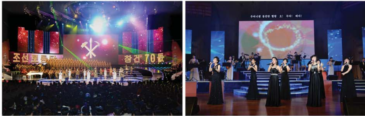
Совместный концерт Заслуженного государственного хора и Оркестра «Моранбон» (слева) и концерт Оркестра «Чхонбон» (справа) в честь 70-летия ТПК.

Большой концерт «Великая партия, славная Корея» с 10 тысячами участников прошел с аншлагом.