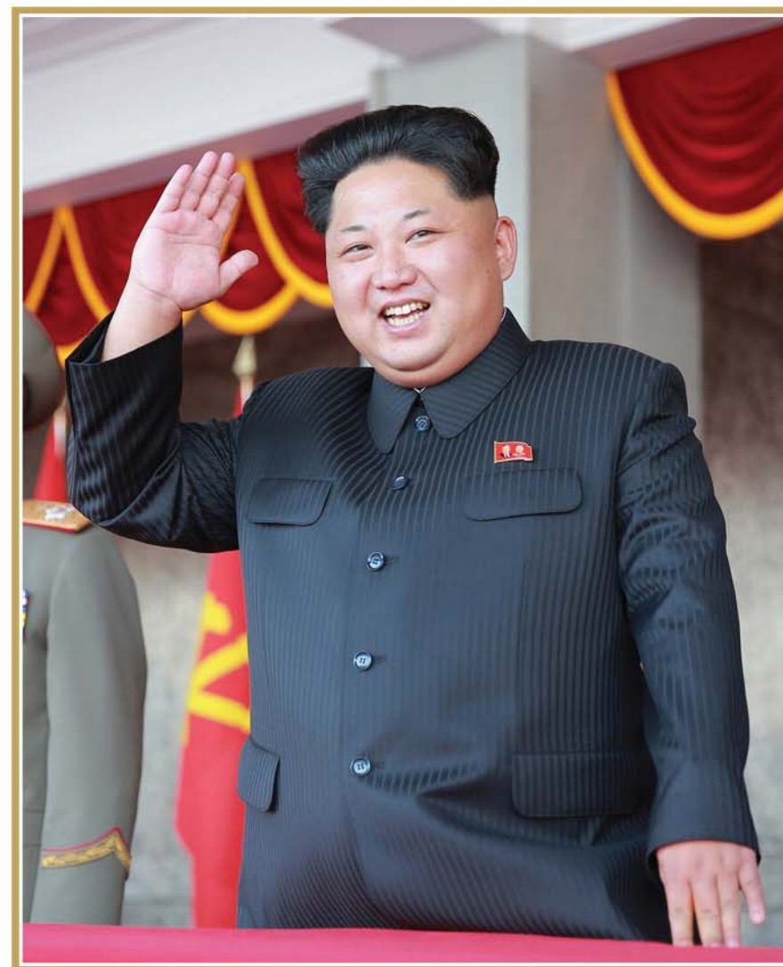
Маршал Ким Чен Ын на массовой демонстрации пхеньянцев по случаю 70-летия ТПК.