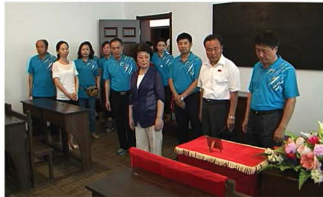
Посетили Юйвэньскую среднюю школу в Гирине.

боевой славы, места историко-революционной славы в Гирине, Цзяохэ, Дуньхуа, Аньту, Ванцине, Яньцзи, Хэлуне, Чэчанцзы, Эрдаобайхэ, Фусуне и других местностях, где запечатлелись немеркнущие заслуги великого вождя Ким Ир Сена в деле освобождения Родины. Они там, возложив букеты цветов и цветки, выразили дань глубокого уважения к антияпонским революционерам старшего поколения и снова познали их пэктуский революционный дух.