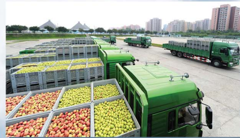
Снабжают горожан фруктами.

Там мое внимание привлекло то, что в каждой бригаде подкармливание почвы и уход за всеми фруктовыми деревьями велись по научно-техническим требованиям. Для повышения плодородия почвы была внедрена кольцевая циклическая система производства, от чего вполне обеспечивались навоз и органические удобрения, а согласно принятым научно-техническим мерам для предотвра-