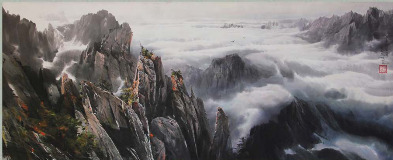
Часть произведений корейской живописи.

Корейская живопись, развиваясь наряду с седой историей нашей нации, оставила множество ценного наследия. Из ее шедевров отличаются когурёские могильные фрески, произведения Тамчжина (579 – 631 гг.) и Сольго (VIII в.), известные мировыми шедеврами живописи в раннем средневековье. В старинных записях передается, что Сольго так живо нарисовал сосну на стене буддий-