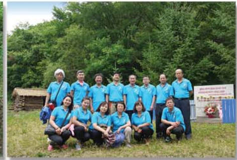
Перед местом историко-революционной славы во время Сяованцинской партизанской базы.

ского движения в нашей стране Кан Бан Сок вела свою деятельность, в Мацуне находился штаб корейской революции, а в Чэчанцзы жители и партизаны опорной партизанской базы, несмотря на свирепую блокаду японских оккупантов, с непоколебимой духовной силой победили голод и отважно сражались с врагами.