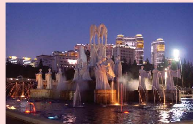
Часть созданной НИИ иллюминации.