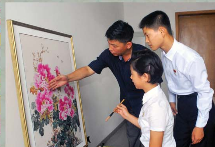
Корейская живопись – одна из любимых видов искусства корейцев.

ского храма Хванрён, что даже летевшие птицы, пытаясь сесть на нее, сваливались на землю.