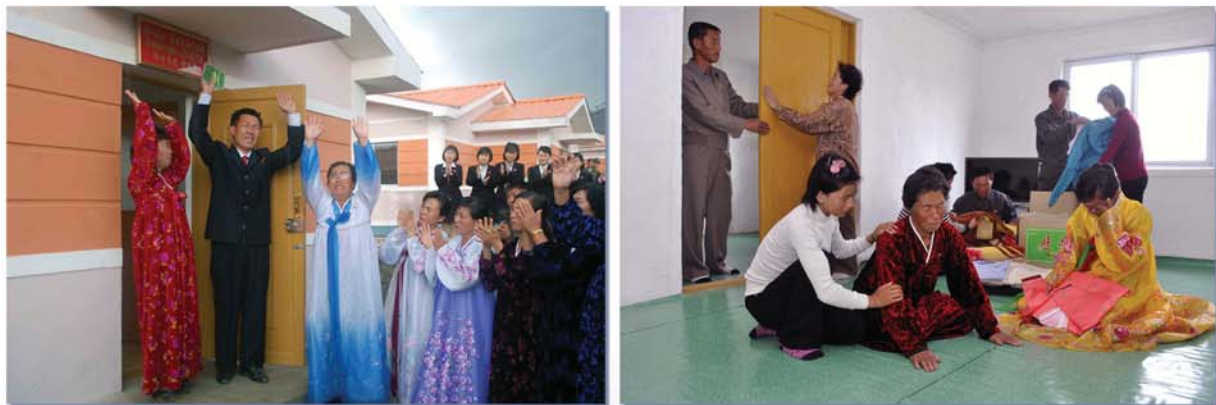
Пострадавшие жители в районе города Расона справляют новоселье.