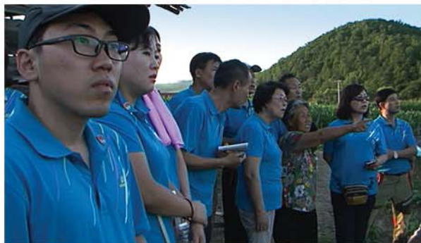
Осматривают Сяошахэ (село Маоцзи в уезде Аньту).

Экскурсанты посетили места революционной и