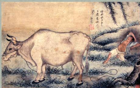
Картина Ким Ду Ряна «Волопас».

Дорогие зарубежные корейцы! Давайте в этом номере ознакомимся с полной национальной колоритом корейской живописью. Наверное, у вас в квартирах и служебных кабинетах имеются разные картины корейской живописи, подходящие вашим вкусам и эстетике. И вы, восхищаясь их красотой, вспоминаете родной край и родственников на исторической родине.