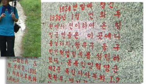
Статья Ю Сон Хва