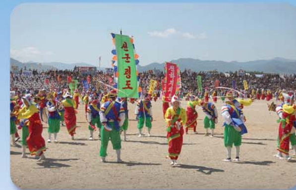
Конкурс исполнения крестьянской музыки жителей уезда Пукчхон.

– При виде спелых яблок на ней я вспоминаю наших великих вождей. Ким Ир Сен радовался, что на этой яблоне уродилось 10 тысяч 300 плодов, обнял ее и открыл новую историю развития плодоводства. А Ким Чен Ир в мае и октябре 2011 года – последнего года своей жизни, посетил наш сельхозкооператив и осветил пути к модернизации плодоводства и перевода его на научную основу согласно требованиям нового века. В результате их глубокого внимания эта плодородная земля приносит нам спелые плоды.