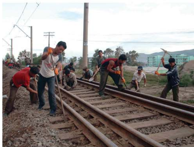
Народноармейцы и горожане Расона ведут восстановительные работы после ущерба.