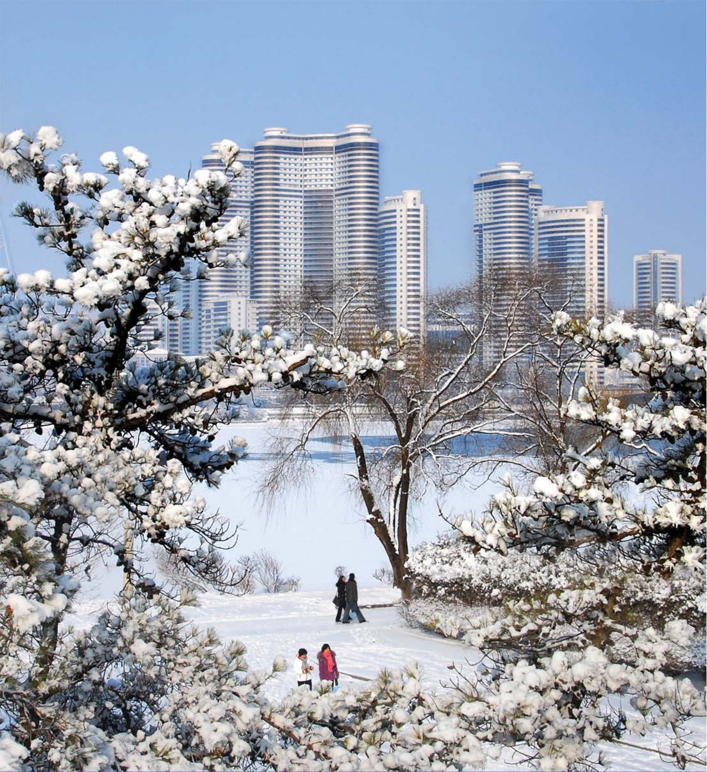
Снежный пейзаж на берегу реки Тэдон.

От покрывшего всю природу снега стоят холода, но в высотных жилых домах на улице Чханчжон как семейных гнездах людей царит весеннее тепло, а на набережной парни и девушки прогуливаются по снегу, лелея красивые мечты о светлом будущем.