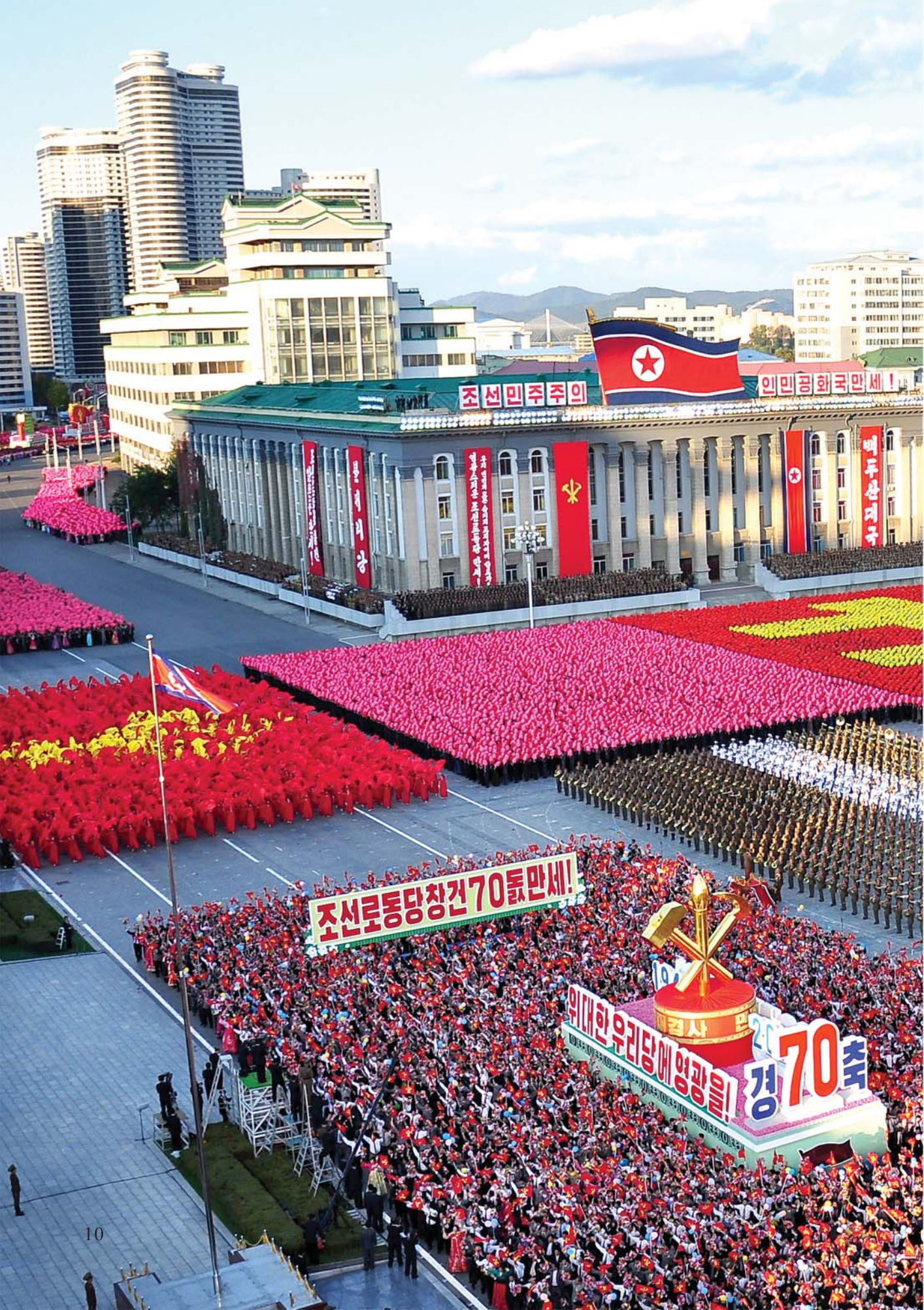
Демонстранты демонстрируют мощь единодушия и сплоченности.