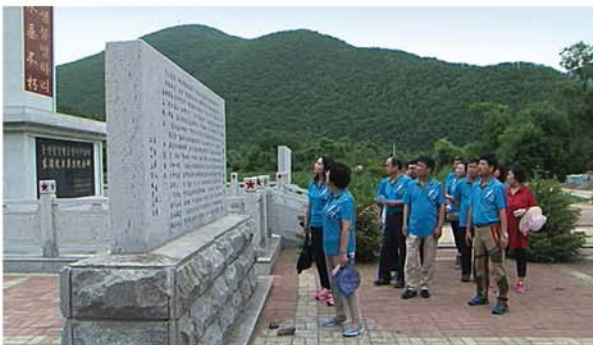
У памятника павшим антияпонским борцам Восточной Маньчжурии.