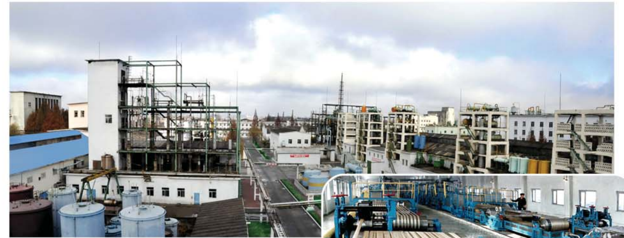
Виналоновое объединение «8 февраля».

Туданский утководческий завод находится в Ракванском районе города Пхеньяна. На нем, где модернизированы все производственные технологии, производятся тысячи тонн утятин в год. Как инку-