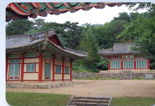
Памятник старины – буддийский храм Кванчже.

Уезжая оттуда, я представила себе прекрасный облик уезда Пукчхон и всей страны, где богато урождаются фрукты.