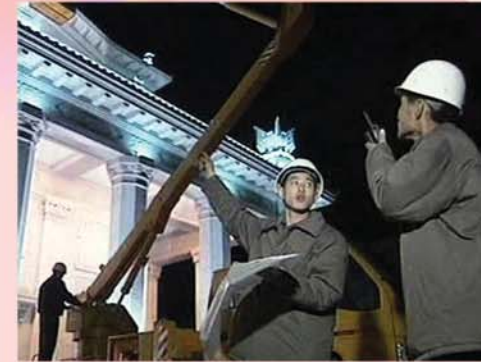
Украшают улицы столицы изготовленными своими силами средствами иллюминации.