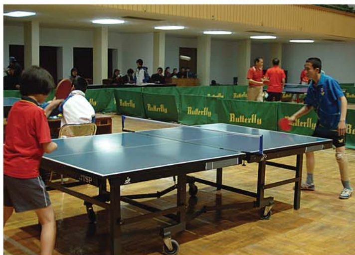
Спортсмены-инвалиды на тренировке и международных соревнованиях.