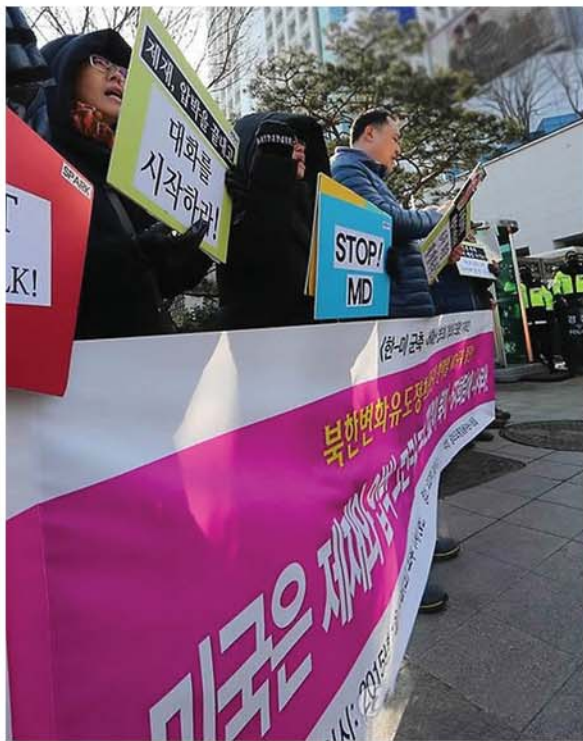
Южнокорейцы осуждают враждебную политику США по отношению к КНДР.