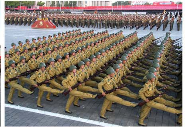
Печатающая шаг, по площади проходят колонны военного парада.